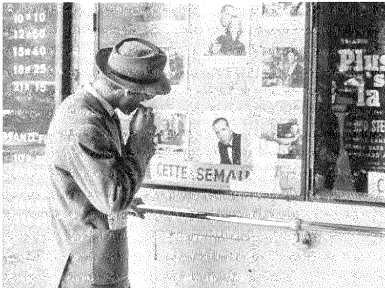
Abb. 4: Jean-Luc Godard, À bout de souffle (F 1960), 16.–19. Min.

Die Geschichte vom Kleinganoven Michel Piccard (Jean-Paul Belmondo), der leichtsinnig einen Polizisten erschossen hat und nun in einem existenziellen Limbo durch Paris streunt, um die Mittel für seine Flucht nach Italien zu sammeln, nimmt das aufs Nötigste reduzierte Handlungsskelett eines billigen Genrestreifens auf und verknüpft die Knotenpunkte physischer Aktion von Flucht und Versteckspiel mit langen Beziehungsgesprächen zwischen Michel und Patricia (Jean Seberg), einer amerikanischen Studentin, die ihn schließlich an die Polizei verraten wird.