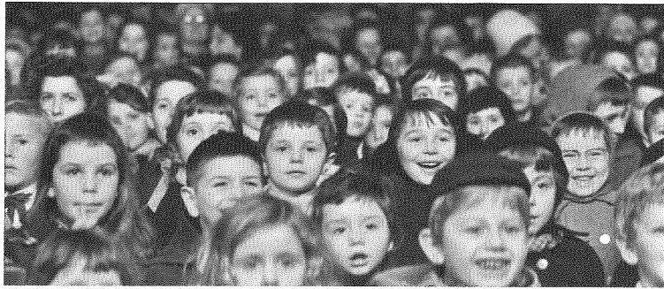
Abb. 2: Les quatre cents coups , 62.–64. Min.

Wenn wir in einer späteren Szene in einem Kasperletheater sind, in dem Rotkäppchen gegeben wird, funktionieren die Einstellungen auf die völlig gebannten Kinder wie Thesen zu einer unmittelbaren, kunstlosen Kamerarawirklichkeit (62.–64. Min., Abb. 2). Und sie führen ihren Beweis gleich mit sich in den Gesichtern der Kleinen, in denen sich das vor ihnen ablaufende Drama des Puppenspiels ungefiltert widerspiegelt, ja wo das Mienenspiel der kindlichen Rezipienten selbst zum eigentlichen Schauspiel wird. Dazu kommen Szenen, die an den Slapstick der Stummfilmzeit erinnern, wie die langsam dahinschmelzende Karawane aus Schülern hinter dem nichtsahnend weiterlaufenden Sportlehrer (45.–46. Min.). Oder Passagen, in denen komplexe Choreographien von Kamerabewegungen und Figuren im Raum an die poetische Logik der Filme Jean Renoirs erinnern, wie etwa die Szenen im Polizeirevier (72.–77. Min.).