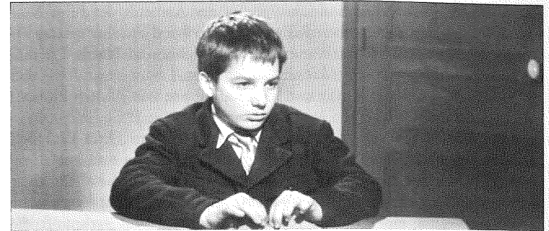
Abb. 3: Les quatre cents coups , 96. Min.

Entscheidend ist dabei der Parcours des Films insgesamt, der mit seiner Titelsequenz nicht nur eine klassische Verortung in Raum und Zeit vornimmt – eine Montage aus Fahrtaufnahmen durch Pariser Straßen, die dem Eiffelturm suchend immer näher kommen –, sondern eine implizite Rahmenhandlung beinhaltet: Das Kind, das am Ende des Films aus der Besserungsanstalt ausgebrochen zum ersten Mal den Strand und das Meer sieht und mit einem berühmt gewordenen freeze frame in die Kamera blickt (96. Min, Abb. 3), feiert seine Rückkehr nach Paris als Filmemacher bzw. als filmische Poetik.