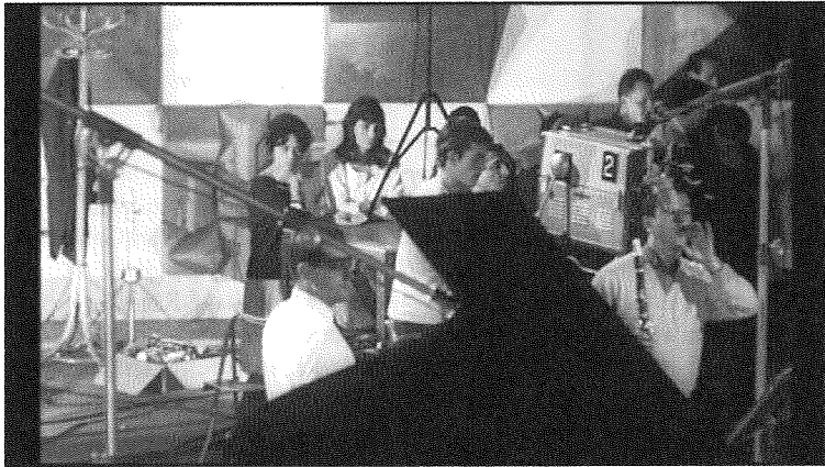
Abb. 10: Jacques Rozier, Adieu Philippe (F 1962), 1.–5. Min.

Die beiden ersten Szenen des Films stecken diesen doppelten Rahmen ab: Die eröffnende Titelsequenz – nach der Schrifttafel, die uns verortet nach „1960, dem sechsten Jahr des Algerienkrieges“ – verwebt die Exposition der Protagonisten mit einer ethnographischen Beobachtung von Medienproduktion (1.–5. Min., Abb. 10).