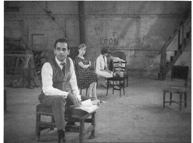
Abb. 8: Paris nous appartient , 61.–67. Min.

schen ausweglosen Welt“ 62 charakterisiert, wobei die Abgeschlossenheit der Welt nach der Zerstörung der Moral bei Aldrich hier eher in die Vielfältigkeit multipler Welten umschlägt: 63 Zimmer, Flure, Straßen, in denen sich verschiedene Figuren in den immer gleichen Andeutungen und Gesten der Verzweiflung artikulieren; Theaterproben, die an immer verschiedenen Orten mit immer anderer Besetzung die immer gleichen Textstellen wiederholen.