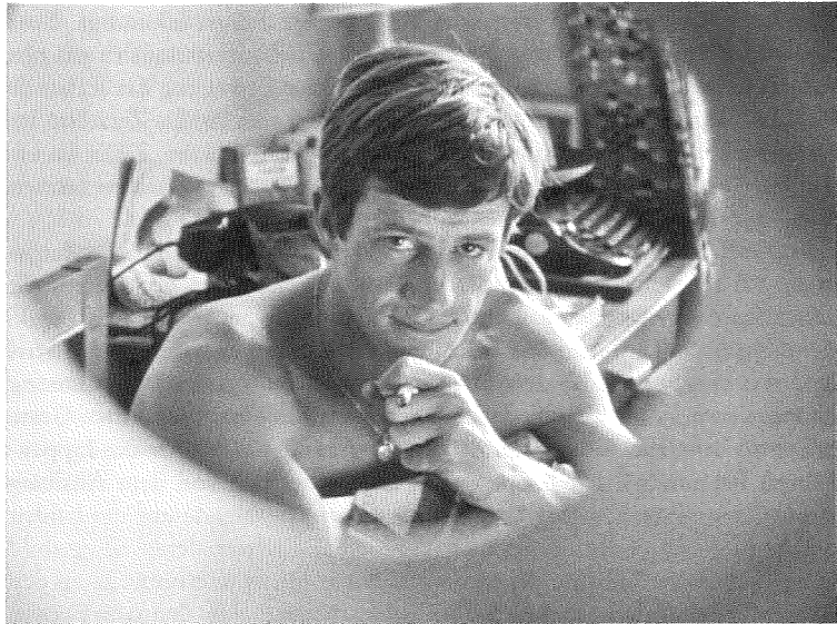
Abb. 5: À bout de souffle , 35.–36. Min.

In einer anderen Szene macht Gene Barry der blutjungen und hinreißenden Eve Brent den Hof [...] Eve verkauft Gewehre. Gene zielt zum Spaß auf sie. Die Kamera nimmt seinen Platz ein, und man sieht Eve durch den Lauf des Gewehres. Kamerafahrt vorwärts, bis die Mündung des Laufs ihre Großaufnahme einrahmt. Nächste Einstellung: die beiden küssen sich. 52