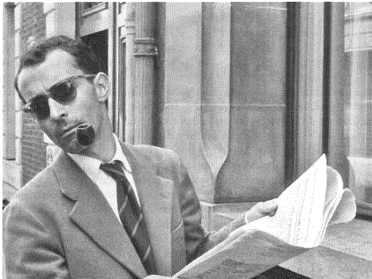
Abb. 6: À bout de souffle , 53.–54. Min.

lichkeit in Künstlichkeiten zersplittern – etwa gegen Ende, nachdem der Verrat geschehen ist und eine über zwei Minuten lange Kamerafahrt erst Patricia und dann Michel durch den Raum streifend filmt, nur um kurz darauf von einer kaskadischen Schnittfolge abgelöst zu werden (81.–83. Min.). Die écriture filmique erweist sich so weniger als Zeugnis eines souveränen, gegebenen Autorensubjekts denn vielmehr als permanenter Selbstentwurf eines work-in-progress , der sich zugleich immer wieder auflöst zwischen persönlichem Ausdruck und generischer Intertextualität, zwischen Fiktion und (Selbst-)Ethnographie. 57 Am Ende findet der Film aus freien Stücken ein vorbestimmtes, stereotypes Ende. Dazwischen vertritt der allmächtige Autor in einem Cameo-Auftritt à la Hitchcock seine Figur, weil es eben die Genrelogik so will (53.–54. Min., Abb. 6).