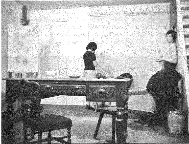
Abb. 9: Paris nous appartient , 95.–99. Min.

Diese Szene ist nun auf einmal selbst ganz frontal gefilmt wie eine Theaterbühne aus einem Zuschauerraum, die Kamera überquert die unsichtbare Rampe nicht, verändert zwar ihre Position, aber stets nur minimal – erst ganz am Ende der Szene, als eine dritte Figur auftritt, verortet sich die Kamera ‚auf der Bühne‘, im Raum zwischen den Figuren. Es ist, als ob die Eigenwirklichkeit des Theaters – nachdem in sämtlichen Probeszenen zuvor die artifizielle Herstellung einer Repräsentation immer mit sichtbar gemacht worden war – hier noch einmal sich ins Recht setzen wollte, um von nun an die Wirklichkeit heimsuchen, um den Punkt zu markieren, an dem kein Autorensujet, sondern der Film selbst, im Dialekt des Theaters, spricht.