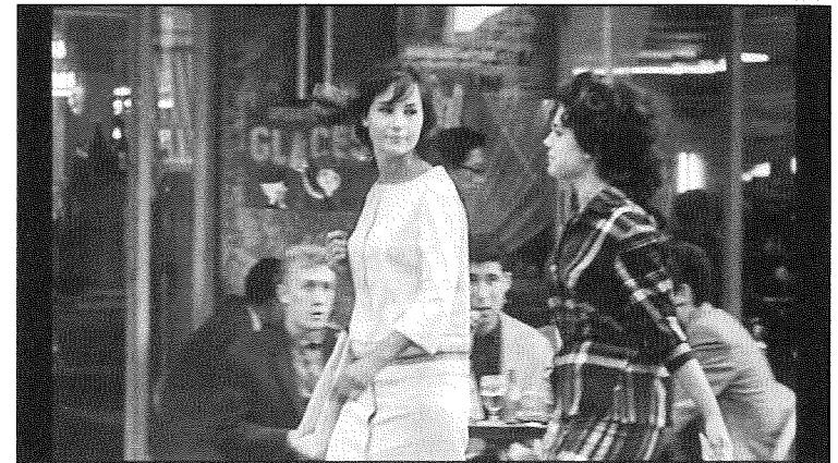
Abb. 11: Adieu Philippe , 30.–32. Min.

einer unhintergehbaren Medienwirklichkeit etabliert hat, präsentiert die folgende Szene das Thema des Films als eine Miniatur seiner selbst. Die drei setzen sich in einem Café an den Tisch und ein Kellner kommt, um die Bestellung aufzunehmen (6.–8. Min.). Dieser Vorgang der Bestellung erweist sich aber als recht kompliziert, Dialog, Schauspiel und Montage wechseln in dieser kurzen Zeit von sprunghafter Beschleunigung zu verzögernder Dehnung, Achsen und Richtungen springen hin und her. Die Mädchen ändern ständig ihren Wunsch, wissen selber nicht mehr, was sie eben noch geordert haben. Am Ende wird durch eine einfache Maßnahme wieder Ordnung hergestellt: Man bestellt eine Cola und drei Strohhalme. Adieu Philippe ist ein Film über das Teilen, über das Improvisieren, über die Jugend als die Fähigkeit und Bereitschaft zur Flexibilität, zum Wechsel der Tempi und der Richtungen.