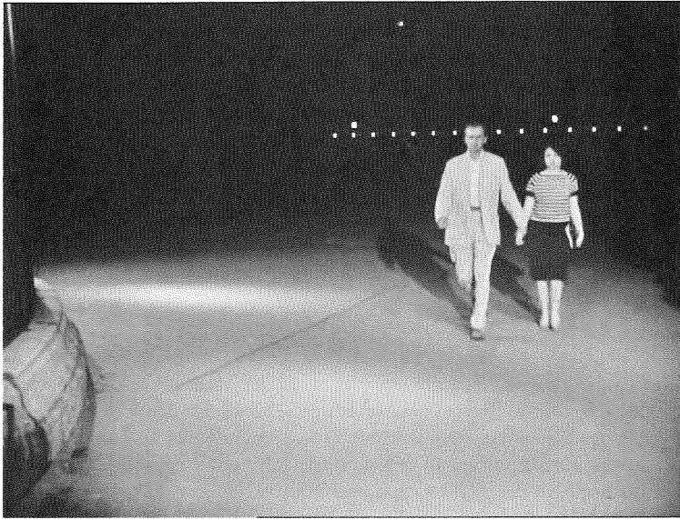
Abb. 7: Jacques Rivette, Paris nous appartient (F 1961), 26.–31. Min.