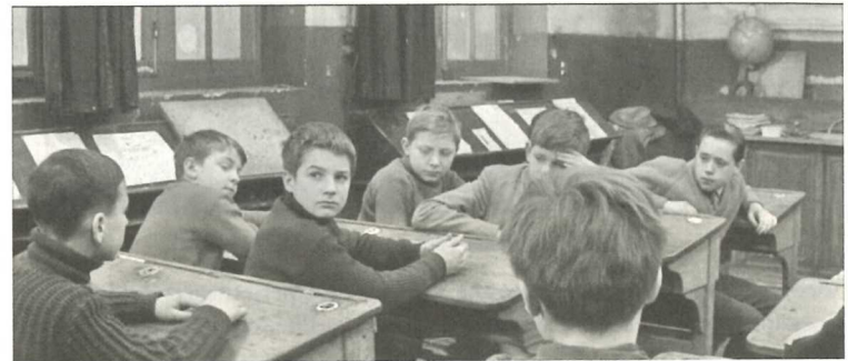
Abb. 1: François Truffaut, Les quatre cents coups (F 1959), 34.–35. Min.

Notwehr gegen erwachsene Ignoranz die falschen Entscheidungen trifft. So werden Kadrierung und Montage immer dann formal streng und rigide, wenn die Erwartungen der Erwachsenen und die Taten des Jungen kollidieren.